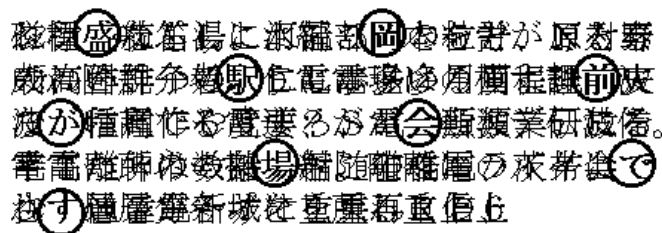
図1 方法1のイメージ

分散テキストを複数枚重ね合わせて、一致している文字を拾い読みすると、秘密テキストになっているようにする方法が考えられる。図1にイメージを示す。